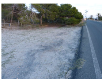
FOTO 6. VISTA DE AREA DONDE SE PRECISA CONTROL DE ACCESO